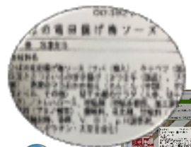
食品表示一例：さばの竜田揚げ

(株)ジョイントのお弁 当を提供させていただ いています。施設給食 として多くの事業所で 取り入れられています。