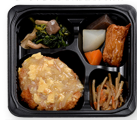
和風カツの卵とじ

昼食のお弁当は、専用 スチーマーで温めて提 供しています。ご飯と 味噌汁はセンターで 作っています。